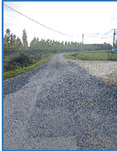
Chemin de Port Leyron